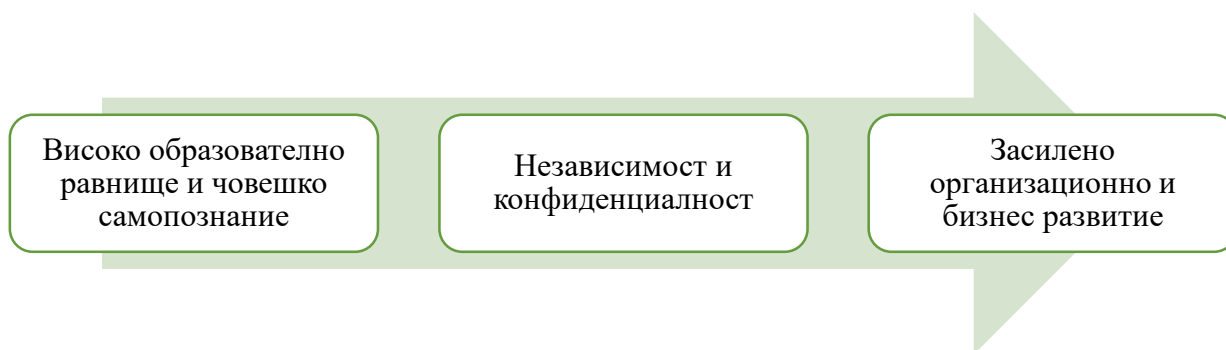
Фиг. 5. Предпоставки за активно развитие на иновативните мерки.

За реализирането на иновативни мерки се изисква административната среда да бъде подготвена и съставена от квалифицирани кадри. Нейното институционално съдействие е изключително важно за популяризирането и напредъка на иновациите. А иновациите от своя страна, предоставят на администрацията дигитализация, опростяване и подпомагане на човешката работна сила. По такъв начин предоставя качествени данни