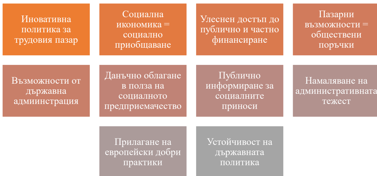
Фиг. 4. 20 . Мерки за насърчаване на иновациите в областта на социалното предприемачество.