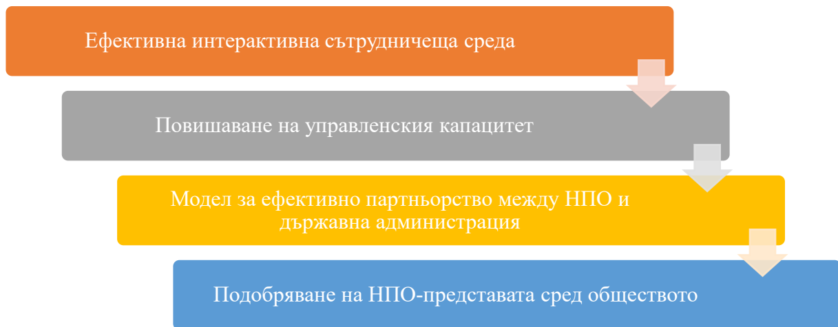
Фиг. 3. 19 . Специфични цели на проект „Партнер-нет“.

подобряване на НПО-сектора, пряко реализиращ политиките на държавната администрация.