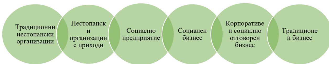
Фиг. 2 10 . Форми на социално предприемачество.

Социалното предприемачество на практика намира израз в социалните предприятия, където реализира всички аспекти на своята дейност. Те се разглеждат в отделни параграфи, поради своите особености на функциониране – съчетание между бизнес и иновации и формиране на социално значими мисии. Но освен неправителствения сектор, социалното предприемачество намира приложение и в административната сфера, и в бизнес сектора. Конкретната реализация зависи от тежестта на социалните нужди. Разликата между всички сектори се заключава във възможността за отдаване на усилия в полза на реализацията на социалното благо 9 .